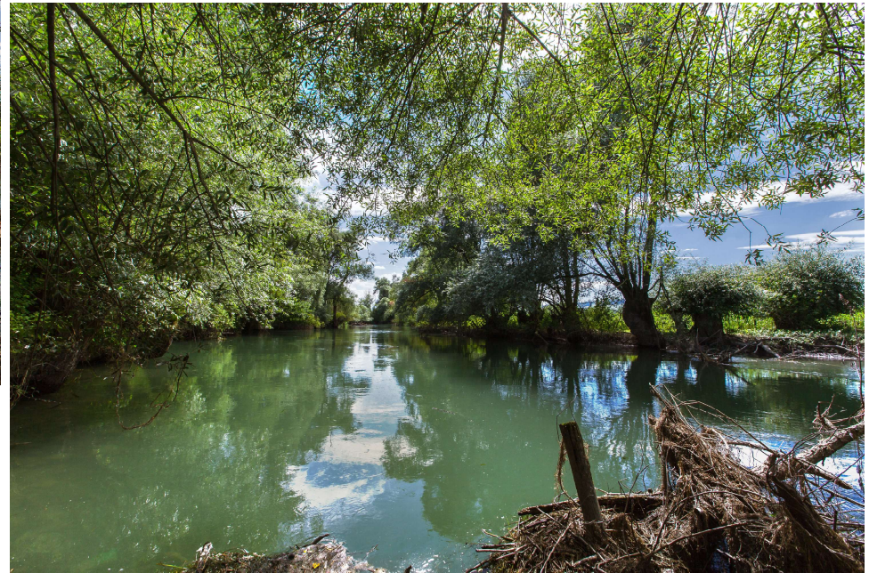
Bearbeitung: zu kühleren, frischeren Tönen